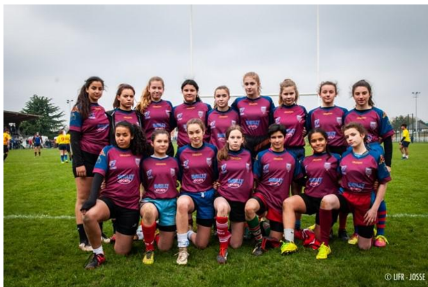
Tableau des 16 sélectionnées :

Ce tournoi sert de support de détection pour les académies pôle espoirs de Dijon, de Lille et de Sceaux.