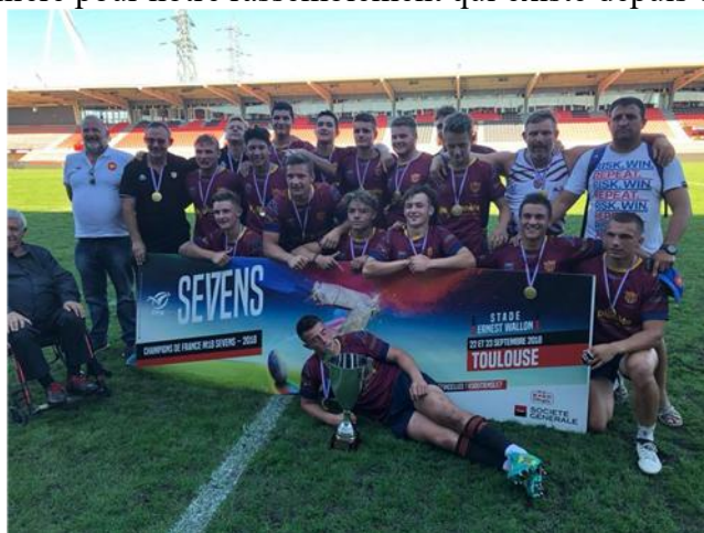
Les Crabos M18 – Champion de France à VII

Avant de débiter le championnat à XV, se déroule les championnats de France à VII Alamercery et Crabos. Après une première phase bien maîtrisée à Massy, les deux équipes avaient rendez-vous à Toulouse pour la phase finale. Nos des équipes se sont bien comportées. Les Alamercery arrivent sur la 3ème marche du podium et les Crabos sont devenus « Champion de France ». Historique, grande première pour notre rassemblement qui existe depuis 14 ans.