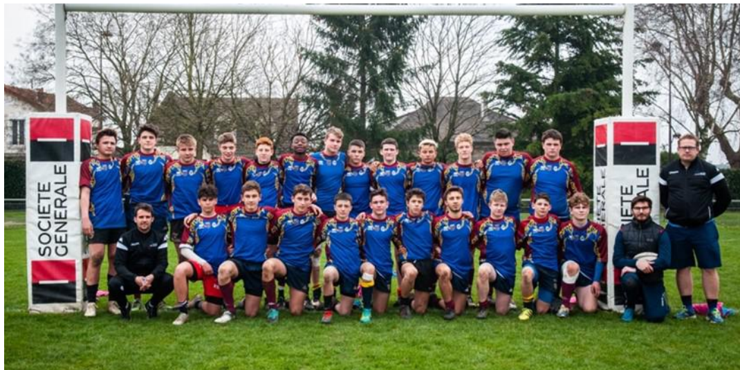
Tableau des 23 sélectionnés m15G :

Ce tournoi sert de support de détection pour les académies pôle espoirs de Dijon, de Lille et de Sceaux.