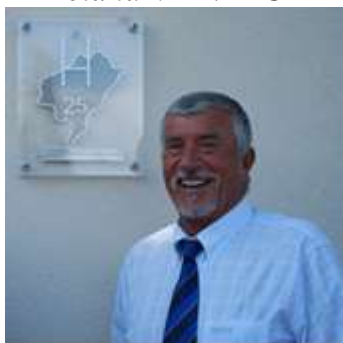
Président du Comité Départemental du Doubs