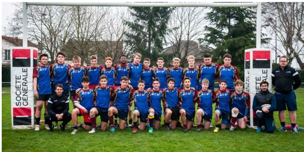
Tableau des 23 sélectionnés m15G :

Ce tournoi sert de support de détection pour les académies pôle espoirs de Dijon, de Lille et de Sceaux.