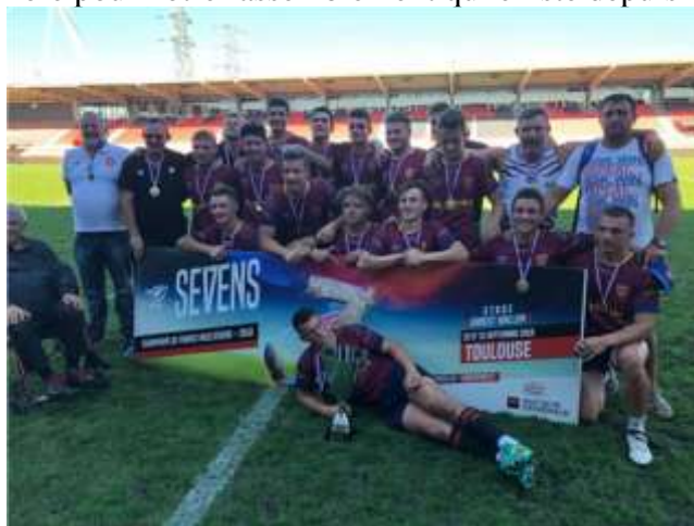
Les Crabos M18 – Champion de France à VII

Avant de débiter le championnat à XV, se déroule les championnats de France à VII Alamercery et Crabos. Après une première phase bien maîtrisée à Massy, les deux équipes avaient rendez-vous à Toulouse pour la phase finale. Nos des équipes se sont bien comportées. Les Alamercery arrivent sur la 3ème marche du podium et les Crabos sont devenus « Champion de France ». Historique, grande première pour notre rassemblement qui existe depuis 14 ans.