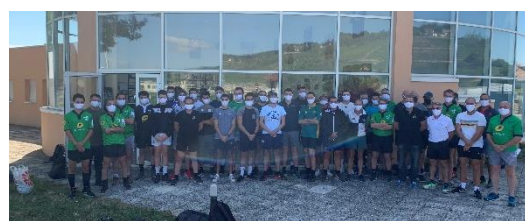
Remise des masques à l'ensemble des arbitres lors du stage de rentrée à Beaune – 05/09/2020